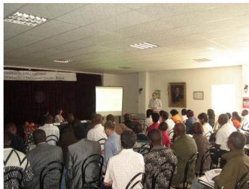
Participantes del Seminario Internacional Derecho a la Alimentación y Seguridad Alimentaria realizado en Angola.

La realización de este seminario en Angola fue muy importante porque se produjo en un momento particularmente oportuno para la participación de la sociedad civil en el debate sobre la construcción de la política de la SAN, en ese momento, en inicio de formulación en el país. Este evento contó con una amplia cobertura de los medios de comunicación, con la participación de los gobiernos centrales y locales y permitió el intercambio de experiencias con las redes de la sociedad civil de otros países de habla portuguesa como la ROSA de Mozambique y el CONSEA de Brasil. Al