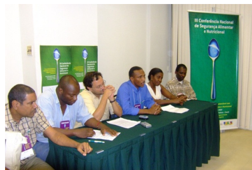
Lanzamiento de la REDSAN-PALOP en Fortaleza en 2007.

La REDSAN-PALOP se inició formalmente durante la III Conferencia Nacional de la SAN, celebrada en Fortaleza (Brasil) en junio de 2007. En el momento de su creación se definieron un conjunto de prioridades que dictaron su estrategia de intervención en los años siguientes: i) fortalecer las acciones de intercambio y el intercambio de experiencias entre los diferentes PALOP aumentando el nivel de información y conocimiento sobre el tema de la seguridad alimentaria y nutricional, la soberanía alimentaria y el derecho humano a la alimentación; ii) Conciliar esfuerzos a nivel de cada país y entre otros varios países para articular las organizaciones interesadas en trabajar conjuntamente estos temas a través de un trabajo en red; iii) Realizar incidencia y defensa política conjunta y de forma solidaria en sus respectivos territorios nacionales dando máxima prioridad a las políticas de combate al hambre y promover la seguridad alimentaria y nutricional que incorporan los principios de soberanía alimentaria y el Derecho Humano a la Alimentación; iv) Conciliar acciones a nivel regional e internacional, con especial atención a la CPLP, los Organismos de las Naciones Unidas, Unión Europea, FAO, entre otros, tratando de influir en sus programas y políticas desde el punto de vista del enfoque conjunto del espacio de habla portuguesa.