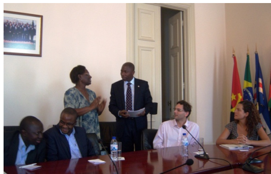
Secretario Ejecutivo de la CPLP recibe contribuciones de la REDSAN-PALOP para la estrategia regional de la SAN.

La REDSAN- PALOP ha participado activamente en la movilización y sensibilización junto a los gobiernos nacionales y a nivel regional frente a la apertura e incentivo manifestada a tal efecto por el Secretario Ejecutivo de la CPLP y la FAO.