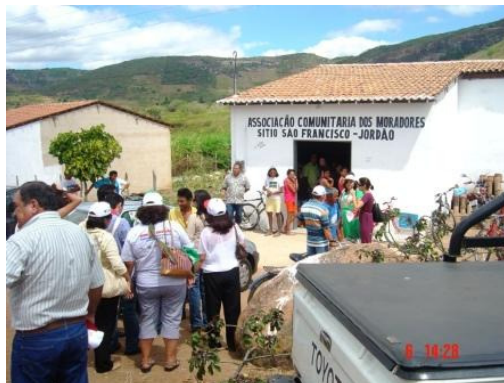
Socios de la REDSAN-PALOP visitan comunidades e intercambian experiencias con el Brasil.

El FBSSAN articula la sociedad civil y, en algunos casos, promueve acciones conjuntas con el gobierno. Entre los principales objetivos de FBSSAN se destacan: i) movilizar a la sociedad en torno al tema de la SAN y colaborar para formar una opinión pública favorable a esta perspectiva; ii) Fomentar la creación de propuestas de políticas y acciones públicas en los planos nacional e internacional en la SAN y el Derecho Humano a la Alimentación, iii) Introducir el tema en la agenda política nacional, estatal y municipal y contribuir al debate internacional sobre el tema; iv) Estimular el desarrollo de acciones locales/municipales de promoción para la SAN; v) colaborar para la capacitación de los actores de la sociedad civil a fin de optimizar la participación efectiva de la sociedad en diferentes ámbitos de gestión social; y v) Reportar y monitorizar las respuestas del Gobierno acerca de violaciones del derecho a la alimentación. El FBSSAN participa activamente en el Consejo Nacional para la Seguridad Alimentaria y Nutricional (CONSEA). Las organizaciones del FBSSAN asumieron en los últimos años un papel importante en la conducción de los principales temas tratados por el CONSEA. Por otra parte, los ex presidentes del CONSEA y la actual presidente, surgieron de las organizaciones participantes FBSSAN 24 .