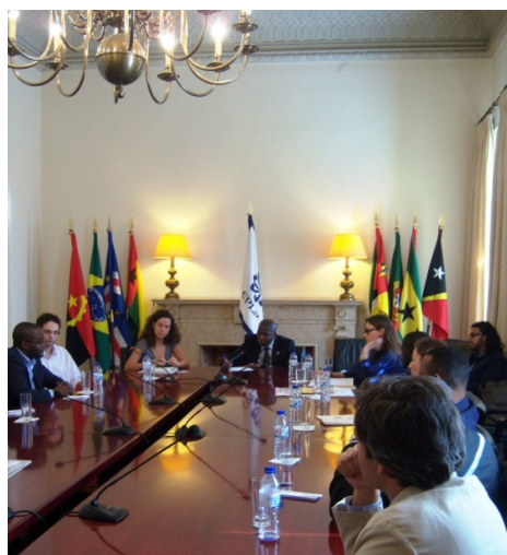
Asociados de la REDSAN-PALOP reunidos en audiencia con el Secretario Ejecutivo de la CPLP en Octubre.

Este proceso ha sido reconocido como fundamental por la propia CPLP durante la audiencia que el Secretario Ejecutivo, Domingos Simões Pereira, mantuvo con la REDSAN- PALOP en octubre de 2011 en Lisboa. En ese momento tuvo lugar en Lisboa la IV Reunión de REDSAN- PALOP facilitada por la ACTUAR. En esta ocasión, ACTUAR movilizó organizaciones de Portugal y Brasil para discutir con las demás redes PALOP el proceso de ampliación de la red regional de la CPLP. La ACTUAR también está fortaleciendo los contactos con las organizaciones en Timor Oriental para el mismo propósito.