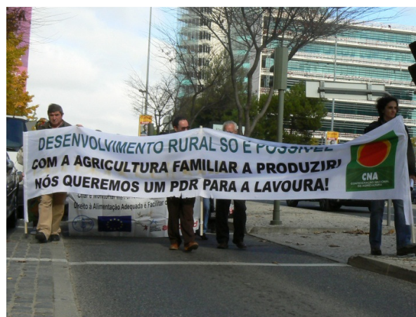
Socios de la REDSAN-PALOP participan con la CNA en Defensa de los pequeños agricultores.

la ACTUAR conjuntamente con otras organizaciones como la CNA, OIKOS - Cooperación y Desarrollo, Instituto Marqués de Valle Flor Instituto (IMVF), Salud en Portugués, Asociación de Consumidores de Portugal (ACOP), la Asociación de Mujeres Agricultoras y Rurales