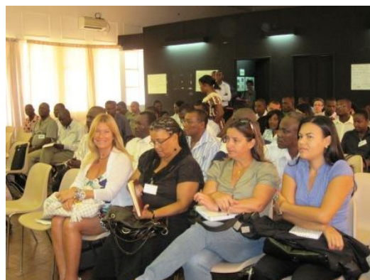
Participantes del Foro sobre Políticas Públicas para la Agricultura y la SAN, celebrada en Santo Tomé y Príncipe.

El esfuerzo emprendido hasta ahora ha sido reconocido por el gobierno y otros actores, siendo la RESCSAN-STP llamada para participar en la formulación de la estrategia nacional para la SAN finalmente reanudada en 2011 con el apoyo técnico de la FAO.