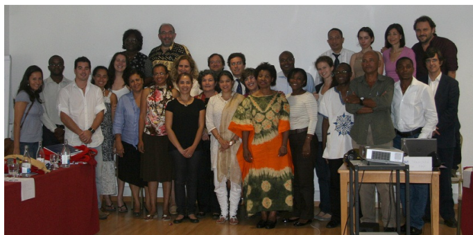
Socios de la REDSAN-PALOP intercambian experiencias y definen estrategias con la FAO y la CPLP en materia de género y acceso a los recursos naturales en Lisboa en 2010.

A continuación, se estableció un grupo de coordinación y se acordó sobre una base de entendimiento para la intervención de la red. Estos principios se plasmaron en un reglamento en el que se definen los objetivos, misión, estructura, mecanismos de gestión y el funcionamiento de la ROSA. Desde entonces, el proceso de construcción y el fortalecimiento de la ROSA fue más rápido, gracias, en parte, al apoyo recibido de algunos organismos internacionales, entre ellos y el más importante, el del proyecto IFSN. Este proyecto permitió a la ROSA disponer de los medios para contar con un coordinador a tiempo parcial, cubrir los gastos básicos con la facilitación de la red y participar en intercambios con otras redes y organizaciones, tanto dentro de la CPLP como en otros países. Hoy, ROSA está constituida por 35 miembros y su misión coloca el foco en la cuestión de la soberanía alimentaria, asumiendo como objetivos principales lograr una intervención coordinada entre sus miembros, facilitar el intercambio de información y experiencias y promover acciones de defensa y diálogo político. ROSA es de ámbito nacional y posee puntos focales en todas las provincias del país. En términos de estructura ROSA está constituida por un Grupo Coordinador, Miembros Ordinarios y la Secretaría.