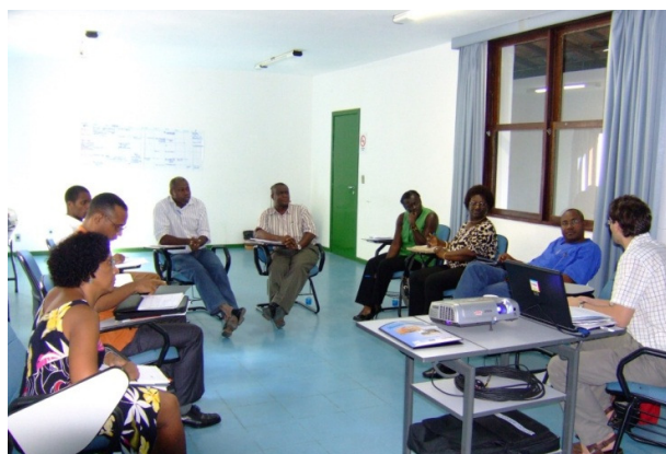
Participes de la REDSAN-PALOP en la II Reunión Regional celebrada en Olinda (Brasil) en 2008.

La PONG's ha participado en numerosas iniciativas de intercambio de experiencias promovidas por la REDSAN-PALOP ayudando a impulsar los procesos de articulación en otros países y promoviendo el intercambio de información sobre diversos temas de interés para otros grupos de trabajo y redes, incluyendo, por ejemplo, el tema del acceso al agua y la conservación de la biodiversidad, entre otros.