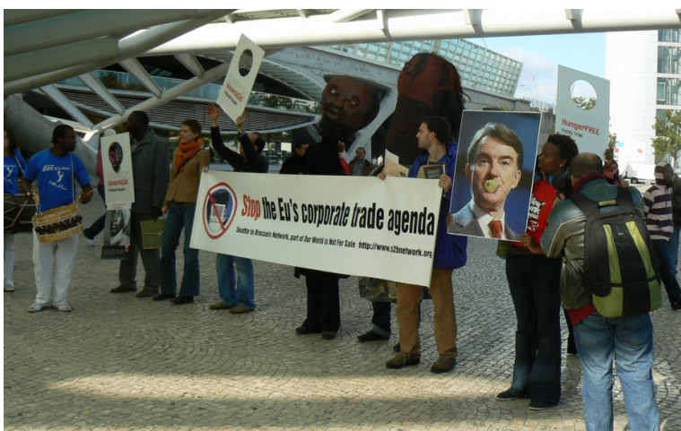
Asociados de la REDSAN-PALOP se manifiestan durante la Cumbre Europa-África (2007) en contra de los acuerdos de asociación económica de la CE con los países de ACP.

Los principales avances realizados por la REDSAN-PALOP hasta el momento fueron los siguientes: