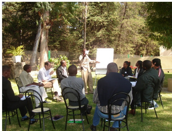
A ROSA comparte su experiencia con otros países de habla portuguesa en el 2007.

Sin embargo, todavía hay muchos obstáculos que superar, tales como: i) la capacidad de varios miembros a asumir las funciones de secretaría y/o. de coordinación activa, ii) la limitación de recursos financieros a diversos niveles para el fomento de capacidades que permitan una regularidad en el trabajo realizado, incluyendo aspectos logísticos y administrativos, ii) Dificultad de descentralización para las provincias, iii) Omisiones en términos de visibilidad y comunicación en varios niveles. El camino recorrido hasta ahora por la ROSA., en África, demuestra la capacidad de movilización de las organizaciones de la sociedad civil, independientemente de los recursos asignados por los donantes. Muestra, sin embargo, que una disponibilidad mínima de recursos puede avanzar más que proporcionalmente el trabajo conjunto y, por último, probablemente lo más importante, existe la posibilidad de trabajar juntando los distintos actores de la sociedad civil con diferentes perspectivas y habilidades en torno a objetivos comunes a la SAN. Estos temas (lecciones aprendidas) serán compartidos al final de este trabajo.