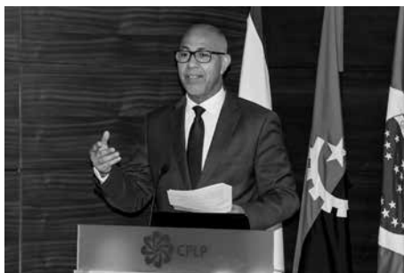
Embaixador Eurico Monteiro