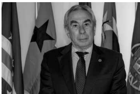
Embaixador Francisco Ribeiro Telles

É com grande satisfação que saúdo a publicação das Atas do Encontro “Mobilidade Académica na CPLP: uma reflexão sobre o presente, um desafio para o futuro”, realizado a 11 de março de 2016, na sede da Comunidade dos Países de Língua Portuguesa (CPLP), em Lisboa.