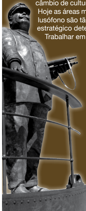
D. Carlos - Escultor: Luís Valadares