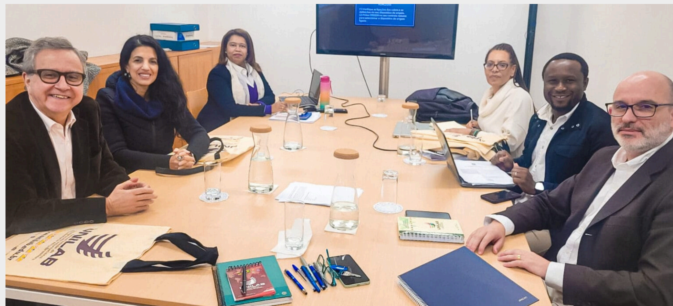
Janeiro 2026. Sede da CPLP (Lisboa, Portugal)